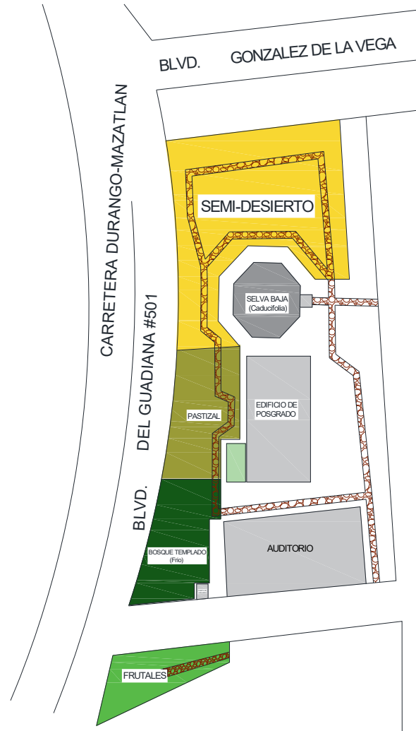
Imagen aérea del jardín

Bouteloua gracilis Bouteloua curtipendula Aristida adscencionis